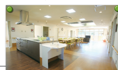
リビングルーム & 談話室

三木市に住民登録がある方で、要支援2・要介護の認定及び認知症の診断を受けられた方が、スタッフのサポートを受けながら共同生活をされる施設です。