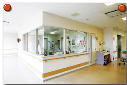
ケアステーション